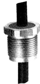
BS 162-.... steckbar